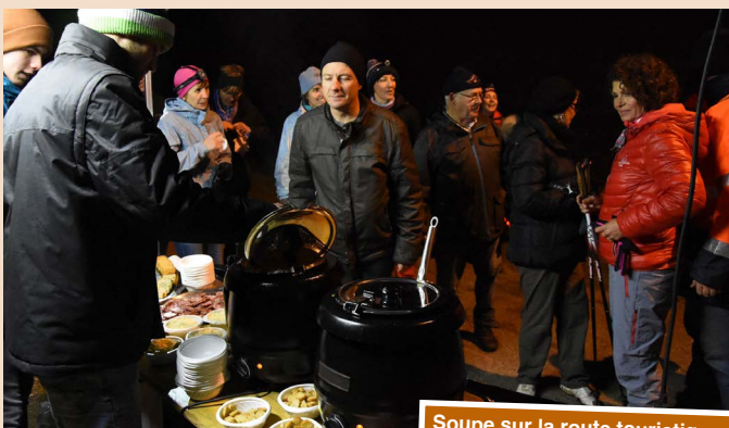
Soupe sur la route touristique.