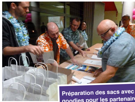
Préparation des sacs avec goodies pour les partenaires.