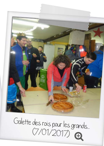
Galette des rois pour les grands... (7/01/2017)