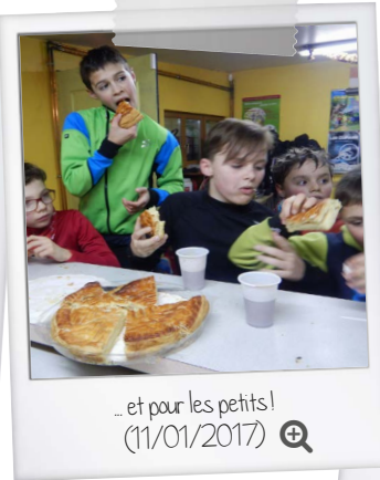
...et pour les petits! (11/01/2017)