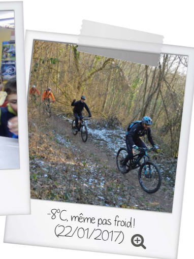
-8°C, même pas froid! (22/01/2017)