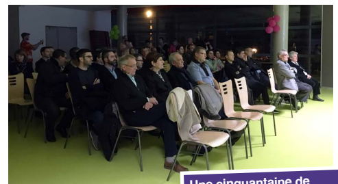
Une cinquantaine de partenaires était présente.