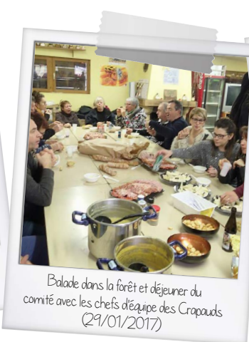
Balade dans la forêt et déjeuner du comité avec les chefs d'équipe des Crapauds (29/01/2017)