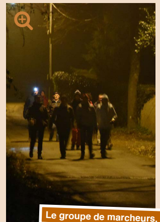
Le groupe de marcheurs.