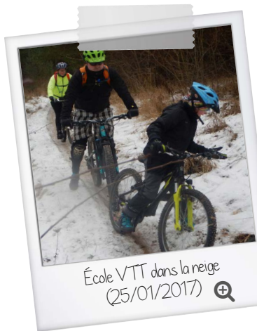
École VTT dans la neige (25/01/2017)