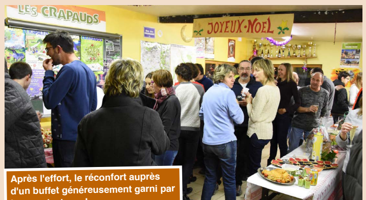
Après l'effort, le réconfort auprès d'un buffet généreusement garni par les rganisateurs !