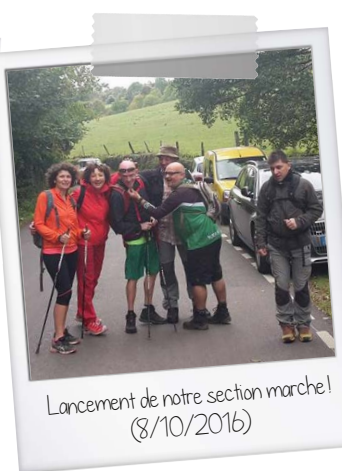
Lancement de notre section marche! (8/10/2016)