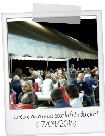
Encore du monde pour la fête du club! (17/09/2016)