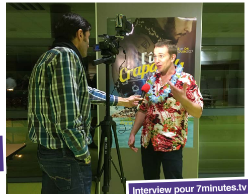
Interview pour 7minutes.tv