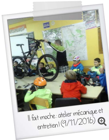
Il fait moche : atelier mécanique et entretien! (9/11/2016)