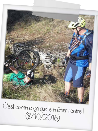
C'est comme ça que le métier rentre! (8/10/2016)