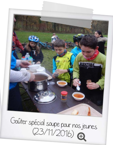
Gôûter spécial soupe pour nos jeunes (23/11/2016)